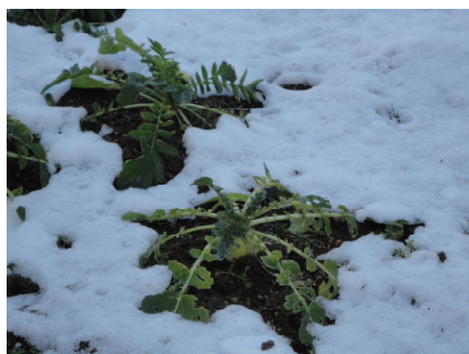
雪が解けたら荒おこしをします

我が家の畑 葉山に行く際に、庭でとれた大根を手土産に持っていました。先月号に写真を載せました、あの妙に短い大根です。事の経緯を話して渡したのですが、後日母から「あれはきつと辛み大根でしょ」と、電話がありました。 いやいや、そんな種は購入しておりません。味は特に辛みが強いわけでもないし、多分普通の大根の種だったはず。まあ確かに形は辛み大根っぽくはあります。謎は解明されません。