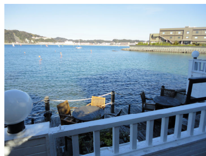
1階のカフェの外部席もおしゃれ

今回、妻の分も合わせて4万5千円ほどを支払って痛感したのは、両親は良くこんな金額を食事に使っていたなということです。兄もおりますので、支払額は同程度の金額だったはず。特別に裕福な家でもなかったのに、恐らく優先的に食事にお金を使い、美味しいものを食べさせてくれていたのだと思います。ありがたいことです。残念ながら、あまり味の違いの分からない大人に育ってしまって申し訳ないです。