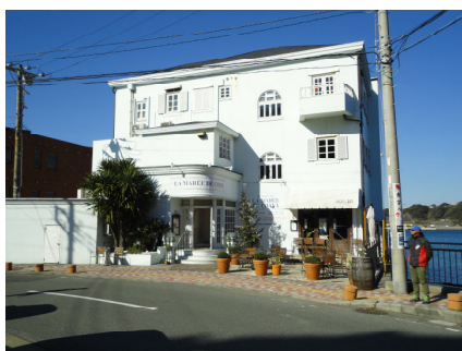
青空と青い海に白い壁が映えますね

お値段はちょっとお高め。ランチコースのメイン料理を葉山牛のステーキに変えて、グラスワインとフレッシュジュースを付けただけで、1人1万円を超えました(涙)。ランチなのに…まあこれだけ払ってもおいしければ問題ないのですが、ちょっと首をひねるような、こんなものだけかな?という感想です。両親も、以前と比べて味が落ちたと言っていました。頑張れ!