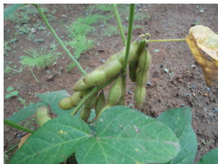
鞘がパンパンです。

全国的に大荒れな今年の夏ですが、幸い上三川はそれほど被害もなく、雨も適度に降って夏野菜は順調でした。ピーマンは山のように採れましたし、オクラも毎日数本収穫できました。坊ちゃんかぼちゃも大収穫です。追加で撒いた早生種の枝豆も間に合ったように、立派に大きな鞘を付けています。今月上旬には、冬大根の種を撒き、すでに立派な双葉が出ています。おでんシーズンに向けての準備も万端です。