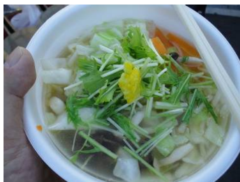
ゆず酢をかけていただきます。

雷都少女(宇都宮のご当地アイドル)と熱烈なファンの皆さんも見ることができて大満足です。