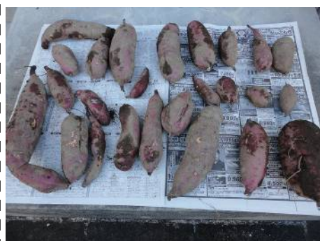
形は不ぞろいです。

我が家の畑 庭の畑に約200粒くらいニンジンの種を蒔きましたが、1粒たりとも芽が出ることなく、打ちのめされている今日この頃です。 晴れ間の続いた後の週末に、サツマイモの収穫を行いました。春先に10本の苗を植え、7本残ったこの収穫量ですから大成功でしょう。もう少し大きめに葉っぱをひっくり返す作業をしたら、もっと大きなサツマイモが採れたかもしれませんが、個人的には十分満足です。