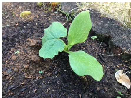
2年ぶりのぼっちゃんかぼちゃです。