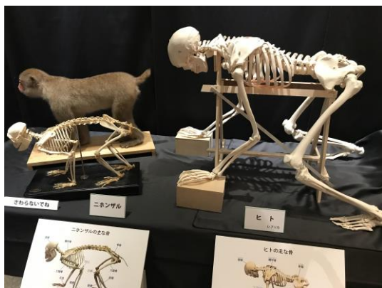
肩甲骨がめっちゃくちゃ大きいです。

今回の企画展は「骨が語る動物の秘密」。県立博物館で作成した動物の骨格標本が展示さ