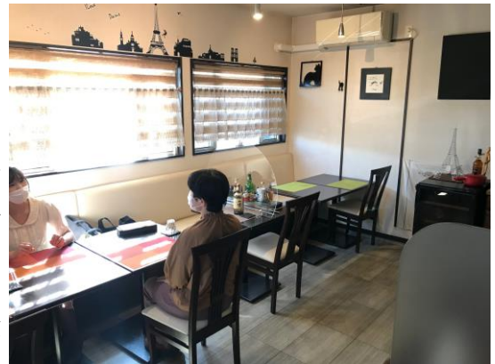
写真右側に本格的なキッチンがあります。

一品目のオードブルからとても美味しかったです。スープはまあまあ、魚、肉ともに最高でした。デザートは甘すぎていまいちでしたが、大満足のランチでした。我々のルールとして、食事中は一切の会話をせず、一皿食べ終わってマスクをしてから感想を言うということを徹底しました。フレンチのコースですと少量ずつ提供されるので、このご時世にぴったりです。