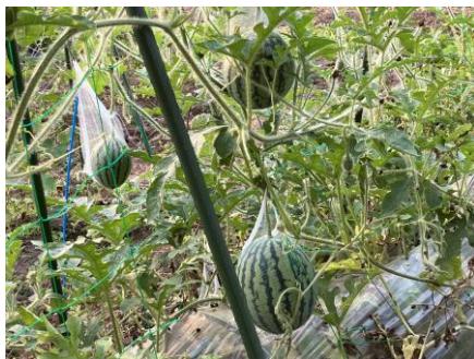
小玉すいかが鈴なりです。

夏野菜は順調に育っています。ピーマン、ナス、トマト、エダマメ、青シソ、カボチャ、きゅうり、オクラ、どれも豊作です。今年初めて空心菜の種を蒔いてみました。今のところ順調です。成長が早く驚きました。ちよつと心配なのが、七月前半は雨が少なかったことです。きゅうりは庭で育てているので毎朝水をやっていますが、畑の野菜には、十分に必要な量の水を確保できません。根元に藁を敷くなどして、乾燥対策をしています。